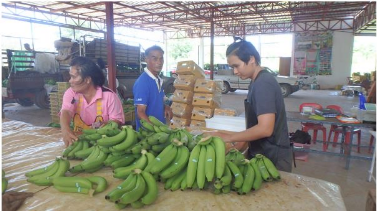
โรงคัดบรรจุ