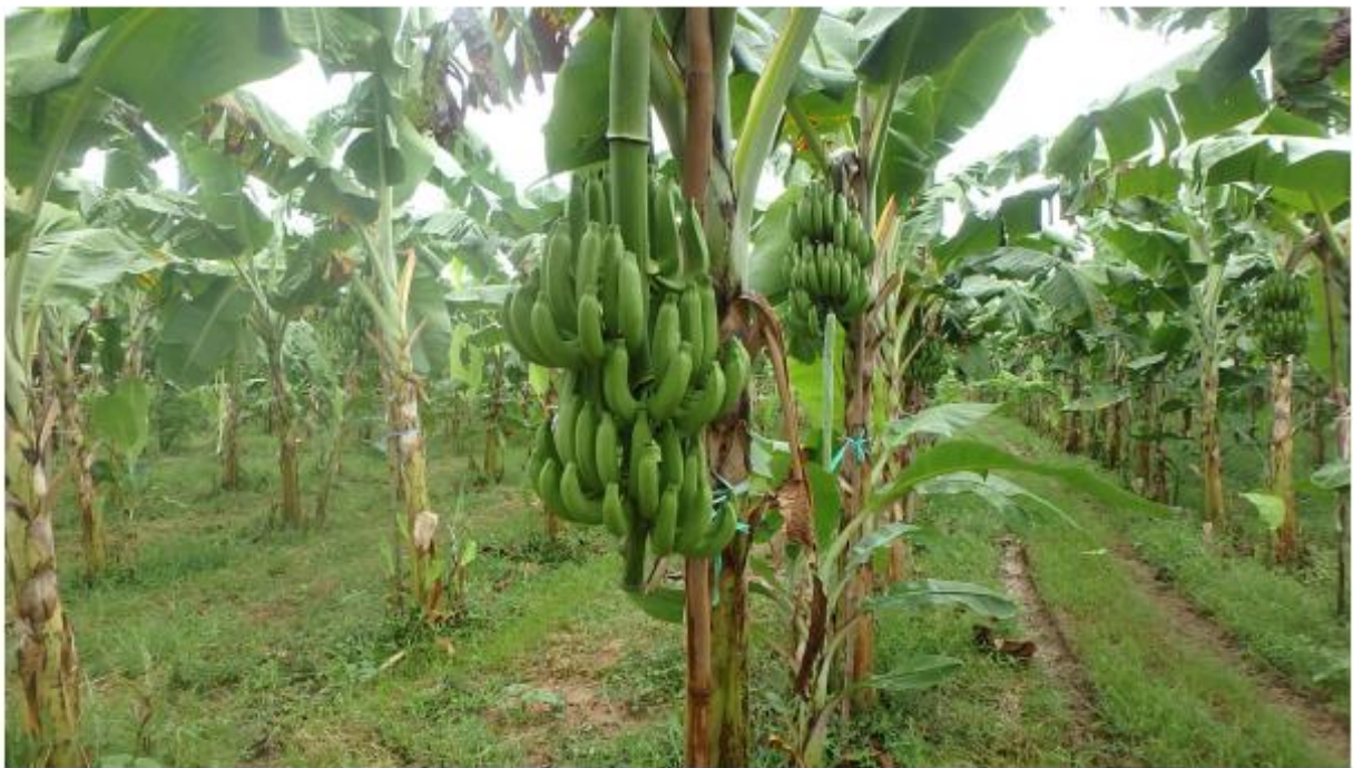
สภาพแปลงกล้วยหอมทอง