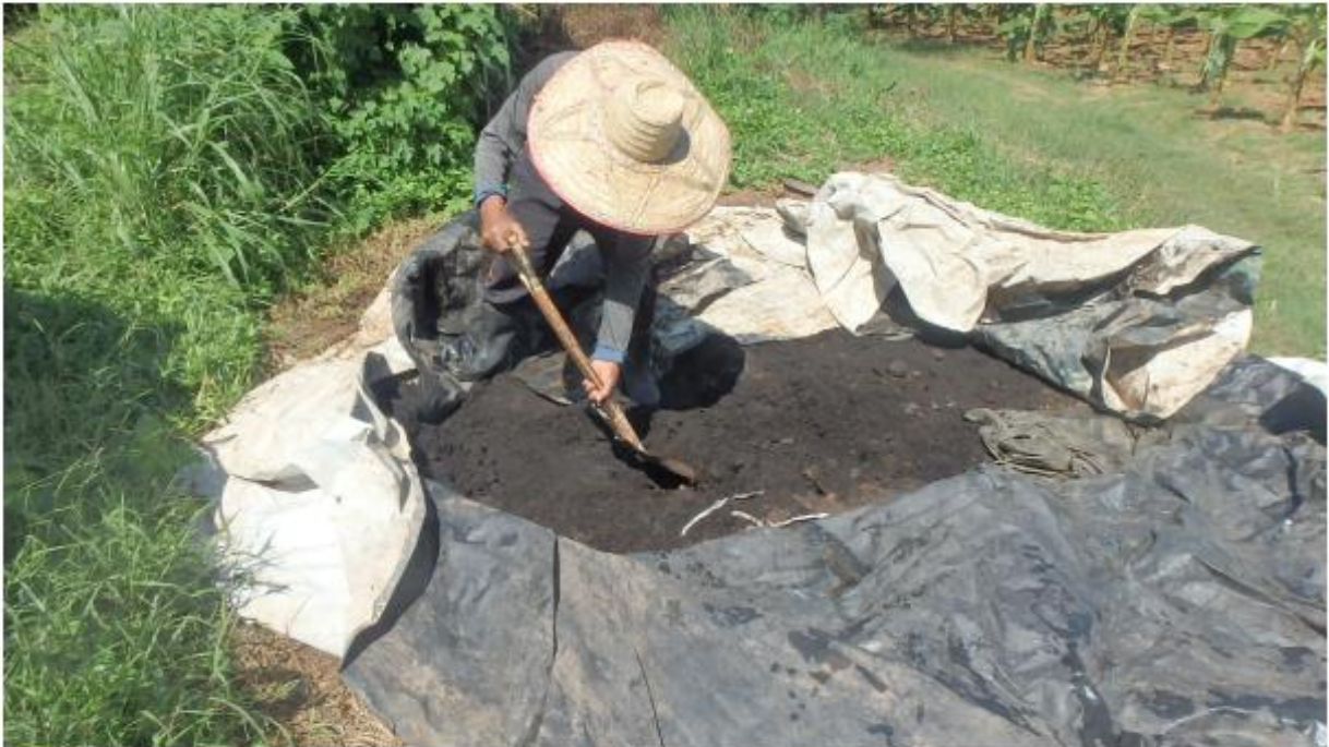
การผลิตปุ๋ยหมักเพื่อใช้กับแปลงกล้วยหอมทอง